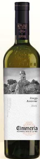
КОКУР-АЛИГОТЕ белое полусладкое

6 шт. в кор. BRUTTO 1,37kg BOTTLE - RESERVE 0,75L