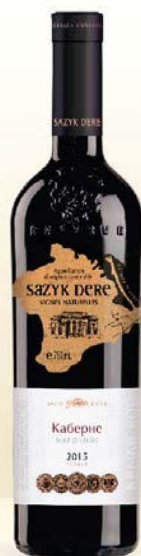
КАБЕРНЕ красное сухое геогр. наименования

Именно здесь вызревает виноград для наших премиальных вин коллекции «Сазык Дерё».