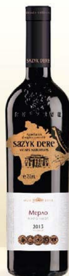
МЕРЛО красное сухое геогр. наименования