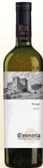
КОКУР белое сухое геогр. наименования