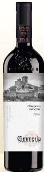
САПЕРАВИ-КАБЕРНЕ красное полусладкое