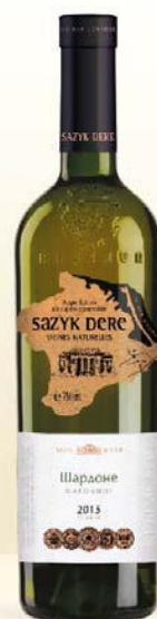
ШАРДОНЕ белое сухое геогр. наименования